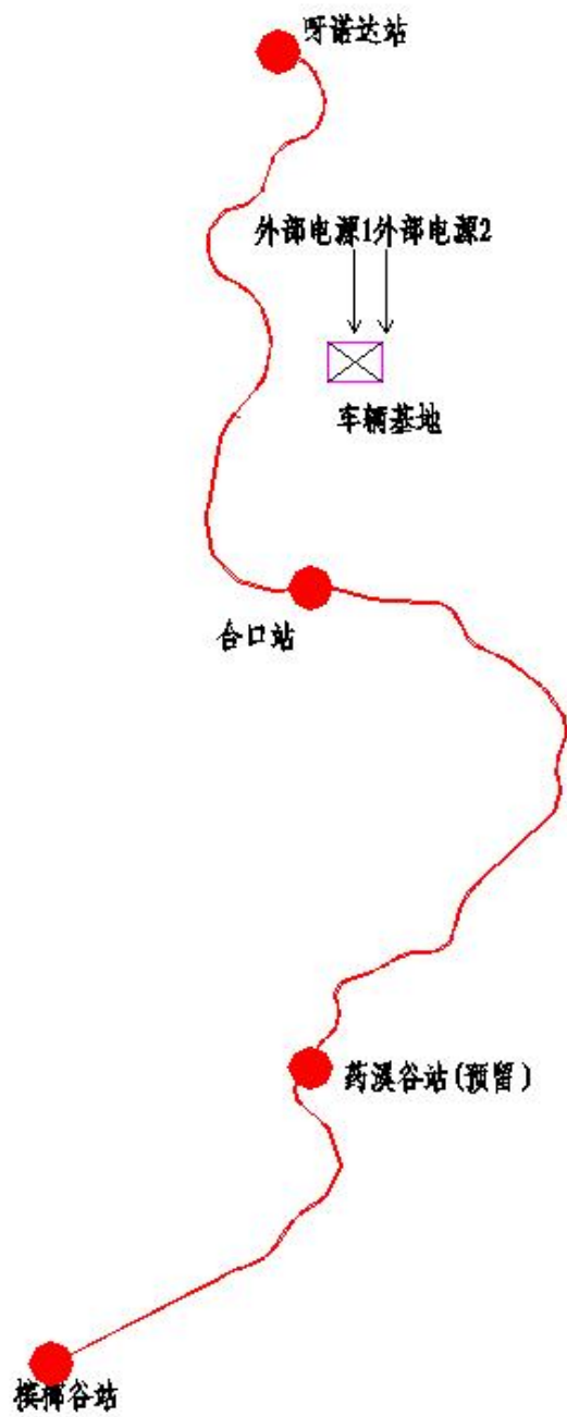
图 4.3-1 变电所分布示意图